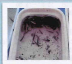
保護されたモツゴ（在来魚）