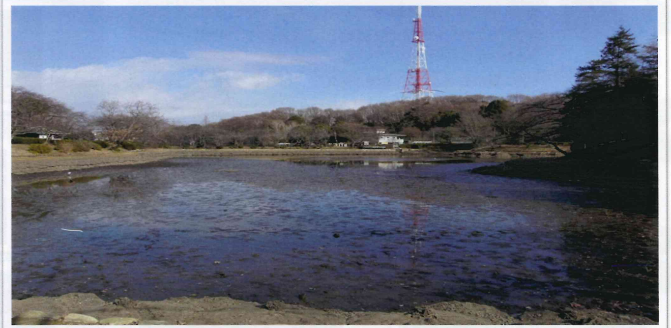
水抜きの完了した下の池

発行お問い合わせ先: 県立三ツ池公園管理事務所 指定管理者 横浜緑地・西武造園・協栄グループ