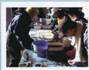
在来魚と外来魚の選別作業