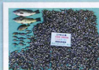
下の池、捕獲成果 ・オオクチバス：2匹 ・ブルーギル：4,831匹