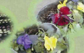
パンジー (パークセンター前)