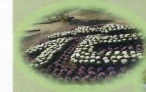
ハボタンの花文字 (花の広場)