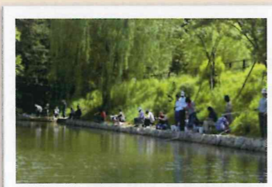
2011年 釣りによる防除