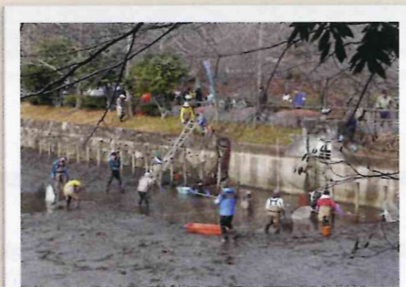
2008年 上の池、かい掘りの状況