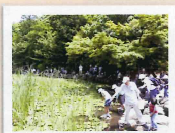
2010年 上の池、ザリガニ釣り