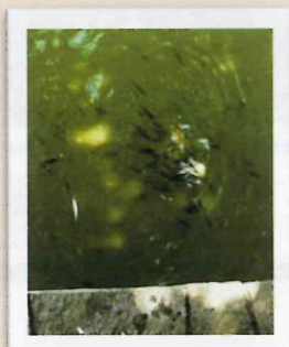
2006年 に池の表面でブルーギルの大群を200匹以上見ることができました。