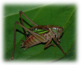
ウマオイ（キリギリス科） マツムシ（コオロギ科） キリギリス（キリギリス科）

鳴く虫というと秋のイメージがありますが、実際には早春から秋の終わりで、さまざまな鳴く虫が声を聞かせてくれています♪