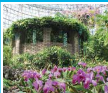
ヒスイカズラ開花時:3月下旬~4月下旬