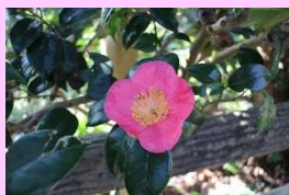
べにみょうれんじ 紅妙蓮寺