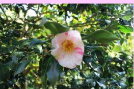
あずましほり 吾妻絞