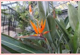
ゴクラクチョウカ