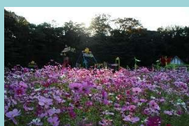
ニオ°スデーシー ハーブ園コスモス