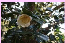
しゅうふうらく 秋風楽