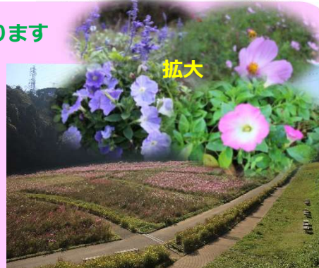
トレイン通路より