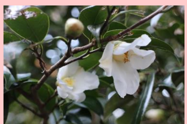
しろわびすけ 白侘助