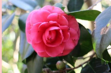
こうおとめ 紅乙女