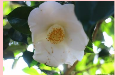
ちゆうぶはくつる 中部白鶴