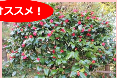
おわりわびすけ 尾張侘助