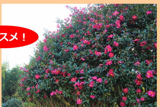
たちかんつばき 立寒椿