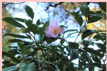
すきやわびすけ 数奇屋侘助