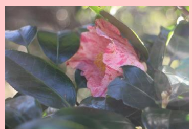
はっさくしぼり 八朔絞