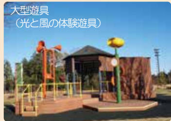
大型遊具 (光と風の体験遊具)

パークセンター内には、公園で採れた木の葉や枝などを使って、自由にクラフト作品が作れるコーナーがあります。 受付時間：9:00~16:00 (作業時間17:00まで) 料金：200円(税込)/1作品